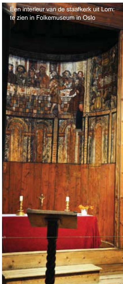
Een interieur van de staafkerk uit Lom: te zien in Folkemuseum in Oslo