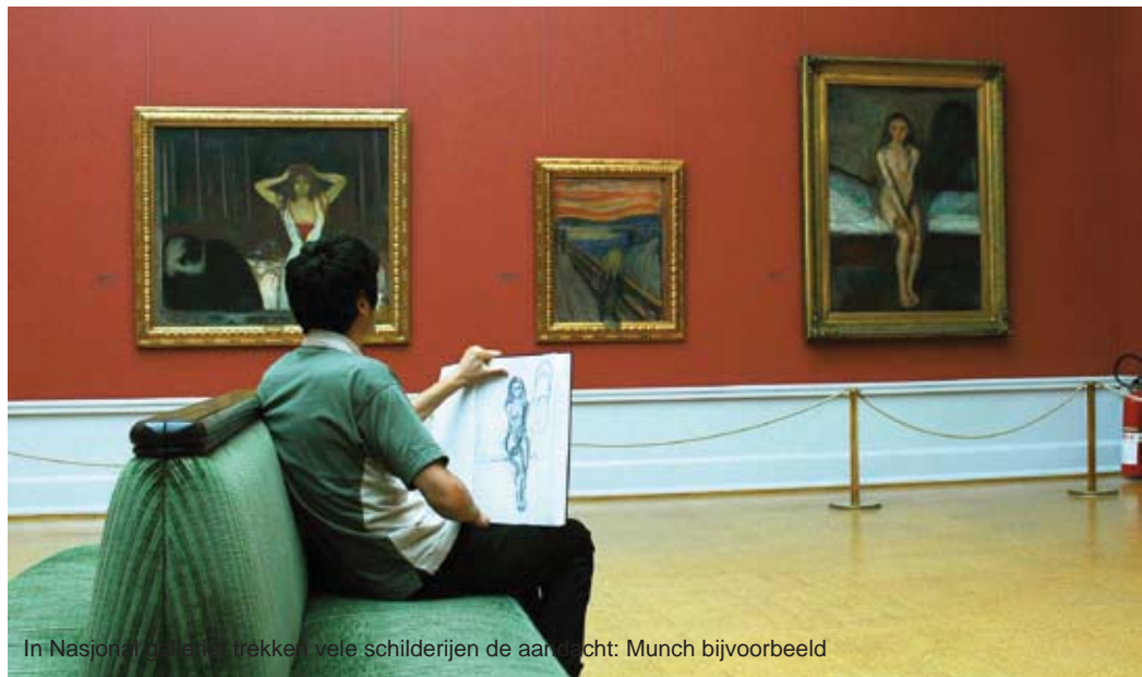
In Nasjonalgalleriet trekken vele schilderijen de aandacht: Munch bijvoorbeeld

Een goed begin van een wandeling in de stad is het Centraal Station. Dit station bestaat uit een oud en nieuw gedeelte.