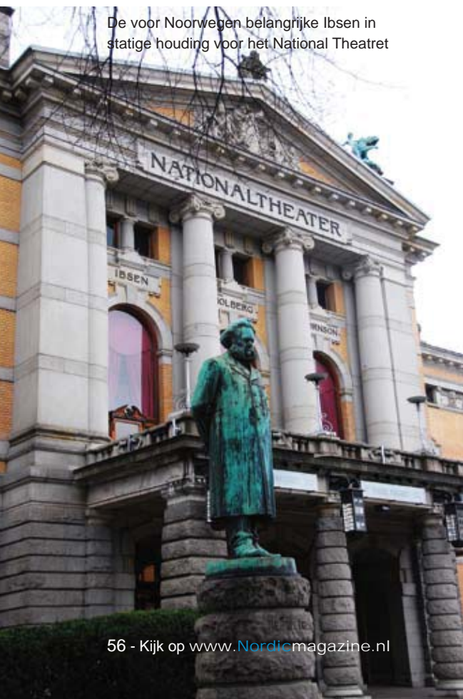
De voor Noorwegen belangrijke Ibsen in statige houding voor het National Theatret

Ook Nasjonalgalleriet in het hartje van Oslo, een zijstraat van de beroemde Karl Johansgate, herbergt een indrukwekkende verzameling schilderwerken uit het verleden. In dit gebouw is het niet moeilijk uren door te brengen. Elke zaal zorgt voor een uitnodigende blik op het werk van de meest uiteenlopende mees-