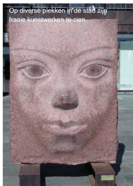
Op diverse plekken in de stad zijn fraaie kunstwerken te zien