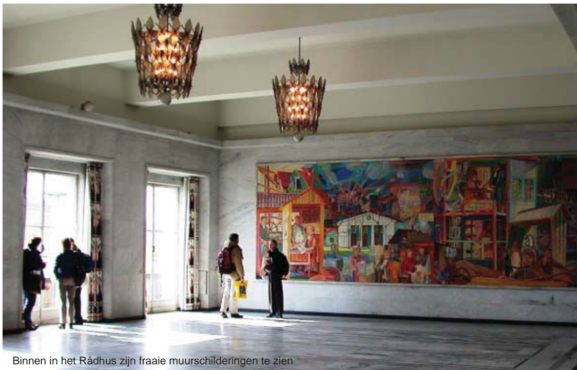
Binnen in het Rådhus zijn fraaie muurschilderingen te zien

Wie de voorkeur geeft aan een culturele buitenervaring kan natuurlijk niet om het Vigelandspark heen, officieel: Vigeland's anlegg. In dit park, dat eigenlijk een onderdeel is van het Frognerpark, treffen we een fraaie verzameling van meer dan tweehonderd stenen en bronzen beelden. Gustav Vigeland maakte ze in 35 jaar, tussen 1907 en 1942. Opvallende verschijningen zijn de granieten beelden van de mens in allerlei stadia. Behalve de perfecte vormen en verhoudingen zijn vooral de details zeer in het oog springend. Zo kun je de aderen zien lopen op de armen op sommige beelden. Boeiend zijn ook de gelaatsuitdrukkingen en andere expressies. Beroemd is het boze kind in een bronzen uitvoering.