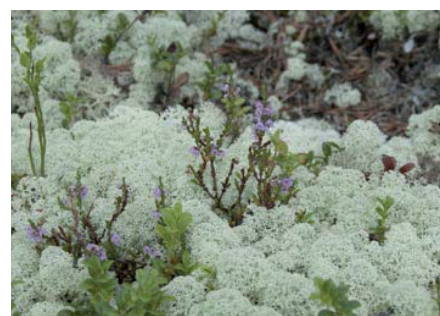
Rendieren leven voornamelijk van rendiermos, dat in de bergen en de toendra's te vinden is

De reden voor een gereguleerde jacht is dat een aantal rendieren iedere winter een tekort aan voedsel heeft. Rendieren leven voornamelijk van rendiermos, dat in de bergen en de toendra's te vinden is. Deze begroeiing is vooral in de berggebieden en het grensgebied van Noorwegen en Zweden te vinden. Behalve dit specifieke mos eten de dieren andere mossen, heide, dwergwilgen en dwergberken. In de winter weten ze met hun hoeven de laatste stukjes korstmoss van de stenen af te krijgen, vaak diep onder de sneeuw. Toch blijft de winter de moeilijkste periode voor deze dieren. Zeker met grote sneeuwval wordt het zoeken naar voedsel steeds moeilijker. Twijgen van bomen zijn dan nog vaak het laatste redmiddel. In sommige gebieden waar weinig voedsel is, kan wel de helft van de jonge kalveren omkomen door gebrek aan voedsel in de winter. Oudere dieren komen vaak beter de winter door met een uitval van maximaal twintig procent. Dankzij een intensief beleid in de Scandinavische landen wordt het rendier met de grootste zorg omgeven om de soorten gezond en op peil te houden. Op die manier blijft het rendier een trouwe verschijning binnen de Noorse natuur en leefcultuur van de Sami. 🐃