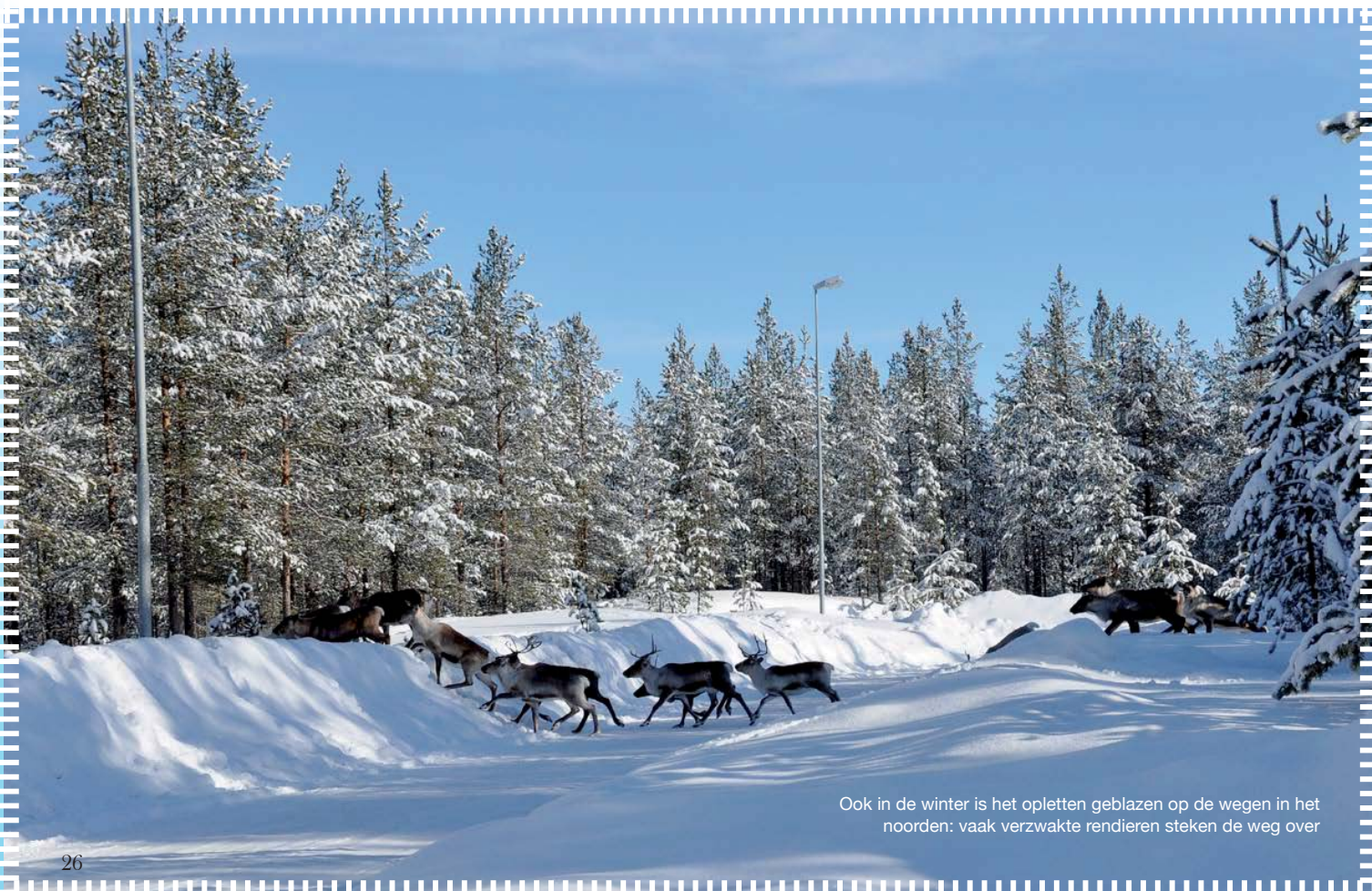
Ook in de winter is het opletten geblazen op de wegen in het noorden: vaak verzwakte rendieren steken de weg over