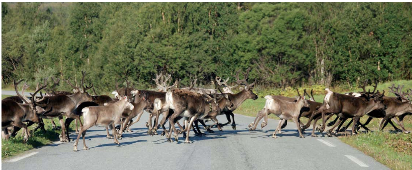
Tamme rendieren gaan in groten getale van het ene graasgebied naar het andere

van 55.000 vierkante kilometer. In Karasjok en Kautokeino zijn twee grote slachterijen. Het Noorse deel van de rendierhouderij strekt zich van het noorden uit tot Hedmark in het zuiden. Dit grote gebied is onderverdeeld in zes Samische weidegebieden en 72 gebieden voor begrazing in de zomer en het gehele jaar. Nog eens tien districten zijn aangewezen voor het verblijf van dieren in de herfst en winter. Ook Zweedse rendierhouders maken hier gebruik van.