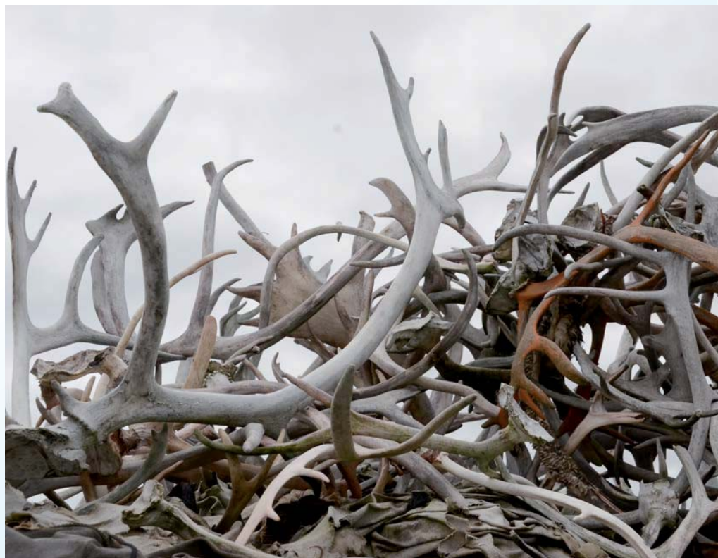
In Noord-Noorwegen zijn rendieren duidelijk in grotere hoeveelheden aanwezig

Het gebruik van rendieren als een vorm van veeveelt bestaat in Noorwegen, Zweden, Finland en Rusland al eeuwenlang. De Noord-Noorse geschiedschrijving spreekt over circa zeshonderd rendieren, waarvan er zes werden gebruikt als lokdieren bij de jacht op wilde rendieren in de negende eeuw. Van pure jacht in het begin van de vestiging in het noorden gingen de noorderlingen over tot het gericht houden van de dieren in de vijftiende en zestiende eeuw. Mede dankzij deze dieren konden hier mensen op deze noordelijke streken wonen en in leven blijven. Het was van oorsprong de gewoonte om alles van deze dieren te benutten: vlees, huid en hoorns en vaak ook alles wat daarna nog overbleef. Ook de melk werd gebruikt. Een volk dat met nauwelijks bezittingen leefde, was wel gedwongen om alles wat ze hadden te benutten. Geïsoleerd in het uiterste topje van Europa leefden de Sami een harmonieus bestaan in gelijke tred met de seizoenen. Het rendier was voor velen een rode draad in hun bestaan: ze leefden ervan, maar ook ervoor. Alles stond in het teken van dit dier. Behalve als bron van voedsel en kleding, was het rendier ook